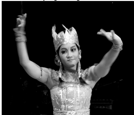
Pengambilan gambar terlalu dekat sehingga badan dan gerakan terlihat tidak utuh/terpotong