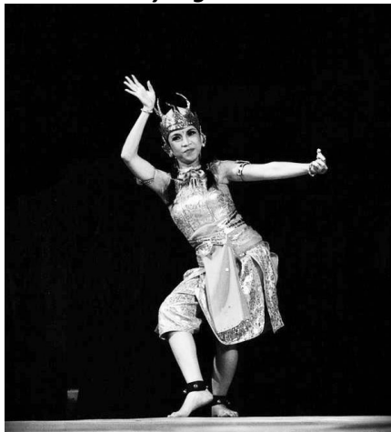
Pengambilan gambar long-shot sehingga seluruh badan dan gerakan terlihat jelas