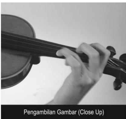
Pengambilan Gambar (Close Up)