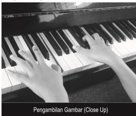
Pengambilan Gambar (Close Up)

Gambar tidak jelas, hanya memperlihatkan bagian badan yang memainkan instrumen musik, sehingga identitas peserta tidak dapat diidentifikasi