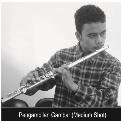
Pengambilan Gambar (Medium Shot)

Seluruh bagian badan terlihat jelas (Peserta sedang memainkan Gitar)